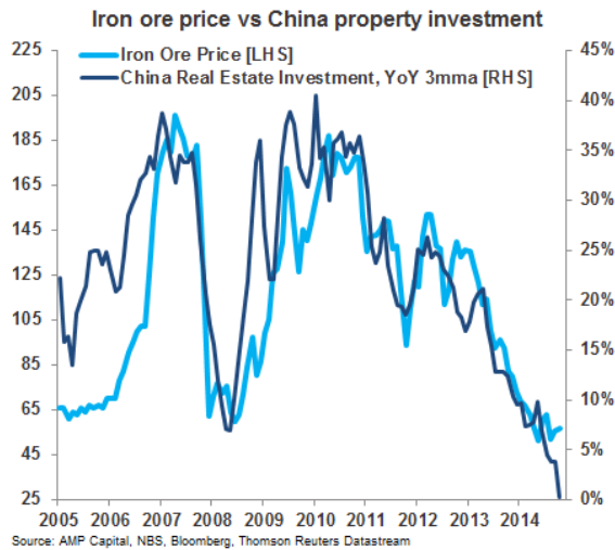
Precio del Hierro vs. Inversión en Construcción en China.