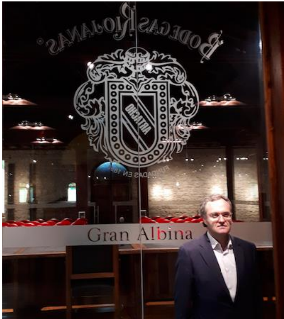
Foto de la visita de a Bodegas Riojanas en Cenicero.

Un aspecto negativo para los próximos ejercicios va a ser la gran helada de 2017 en La Rioja y otras D.O., que ha supuesto un alza del 20% en los precios de la uva. Bodegas Riojanas se aprovisiona externamente de gran parte la uva dedicada a su producción vinícola. Eso añadirá algo más de presión a sus márgenes, especialmente en sus ventas nacionales, que suponen la mayor parte de su facturación.